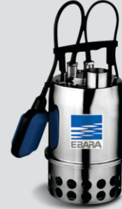
BEST ONE VOX

Curvas publicadas e critérios de aceitação conforme Norma ISO 9906 anexo A